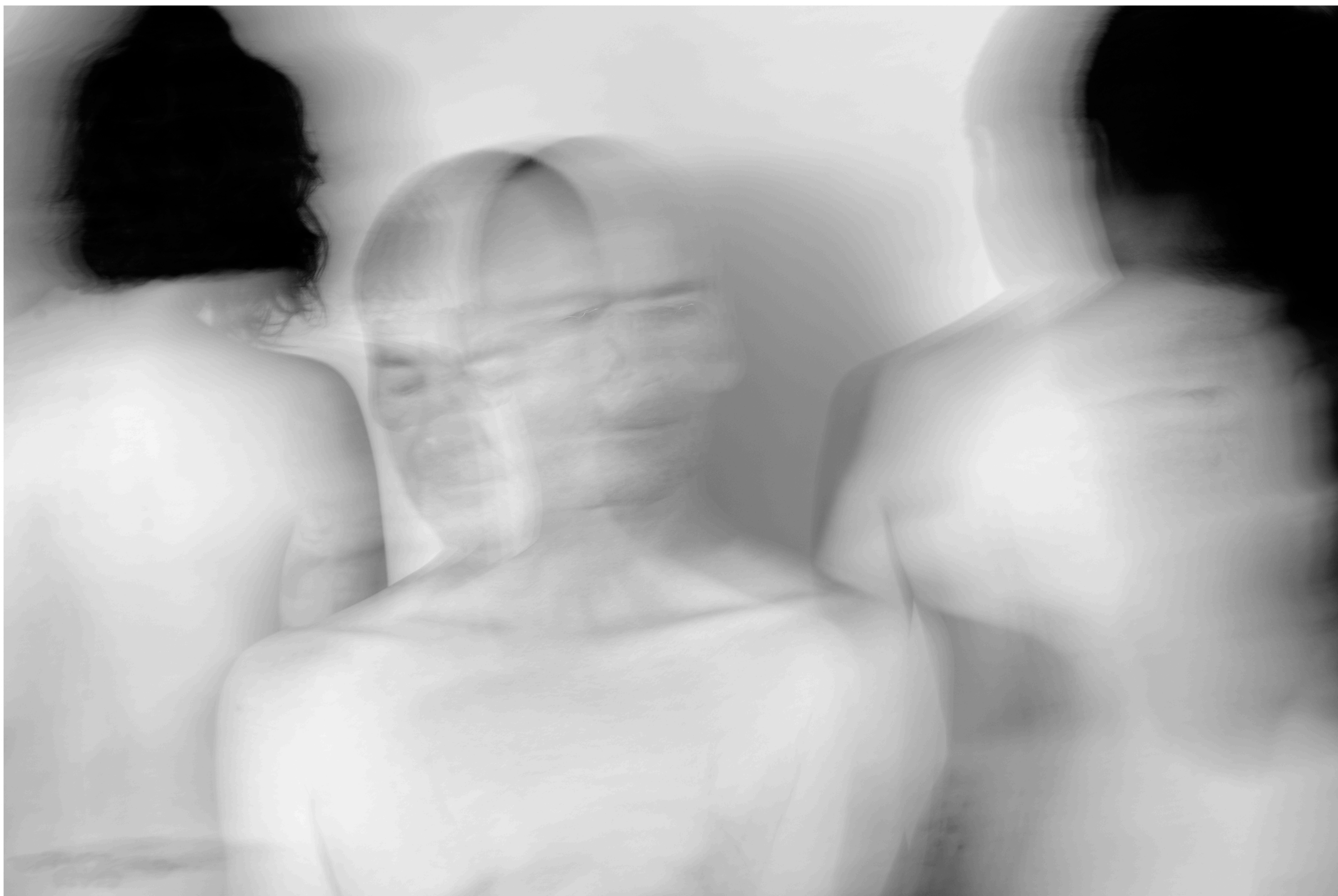
TÍTULO: Huésped IV DIMENSIONES: 60 x 40 cm TÉCNICA: Digital Año: 2021