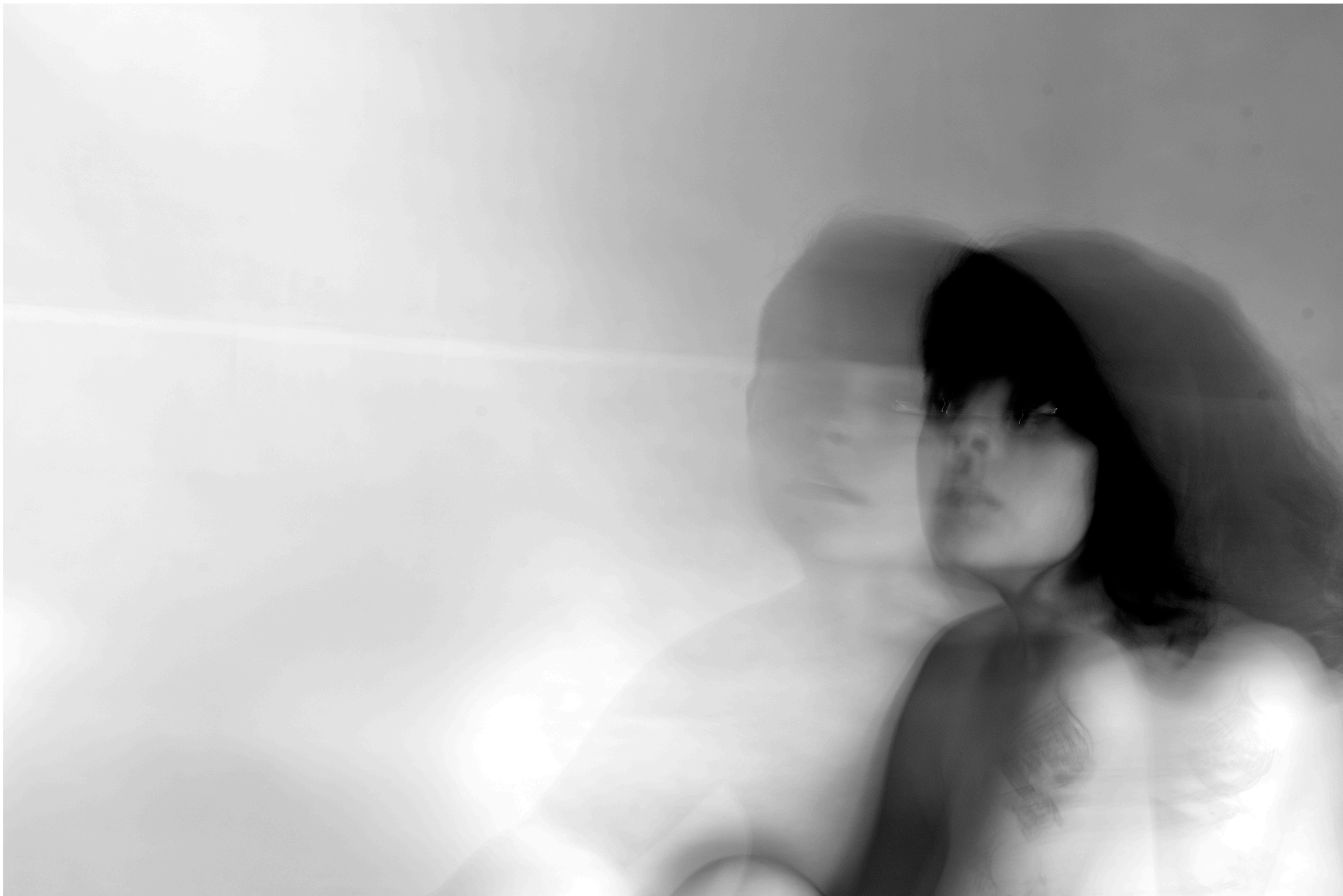
TÍTULO: Huésped V DIMENSIONES: 60 x 40 cm TÉCNICA: Digital Año: 2021