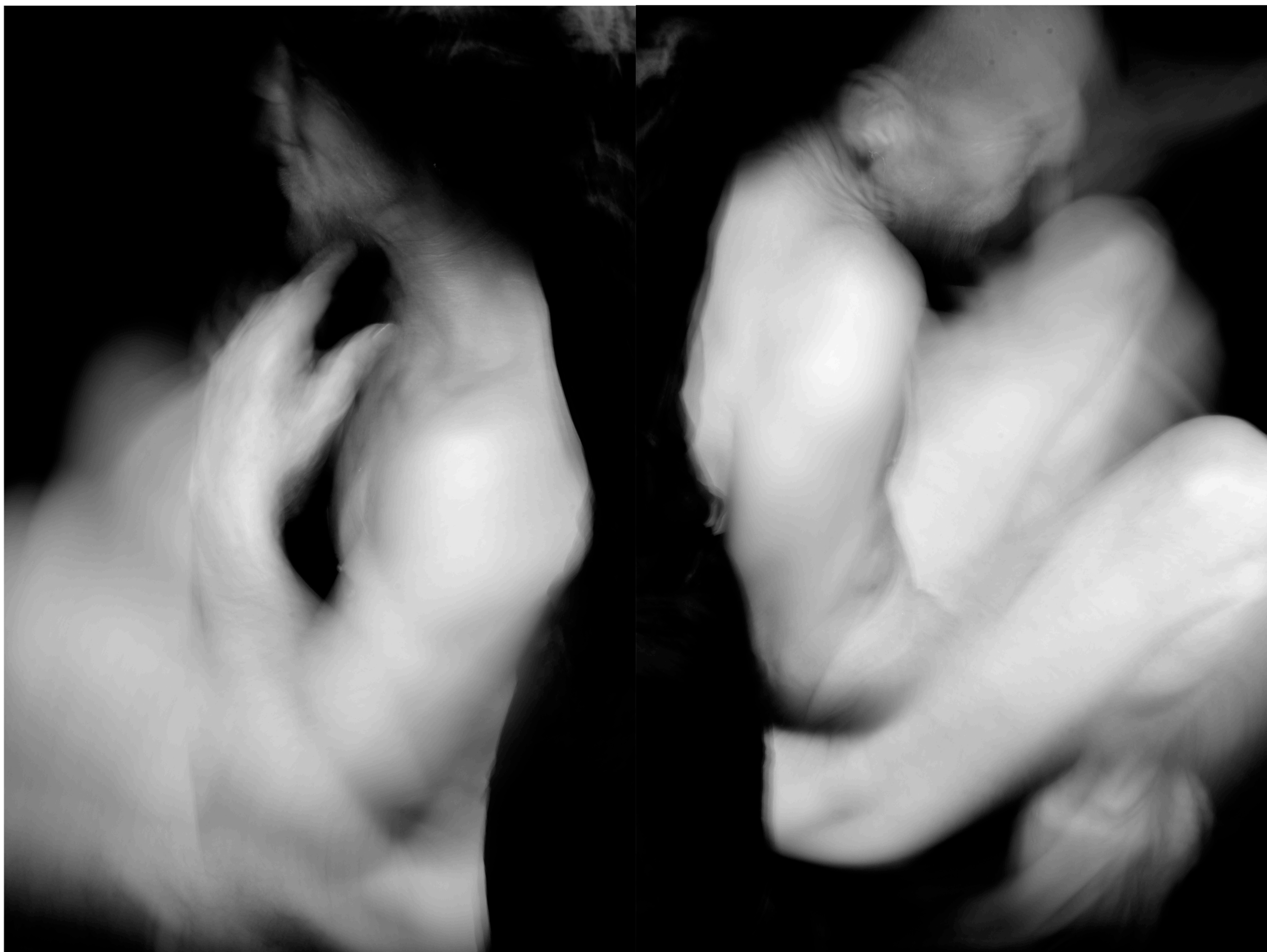
TÍTULO: Huésped III DIMENSIONES: 60 x 40 cm TÉCNICA: Digital Año: 2021