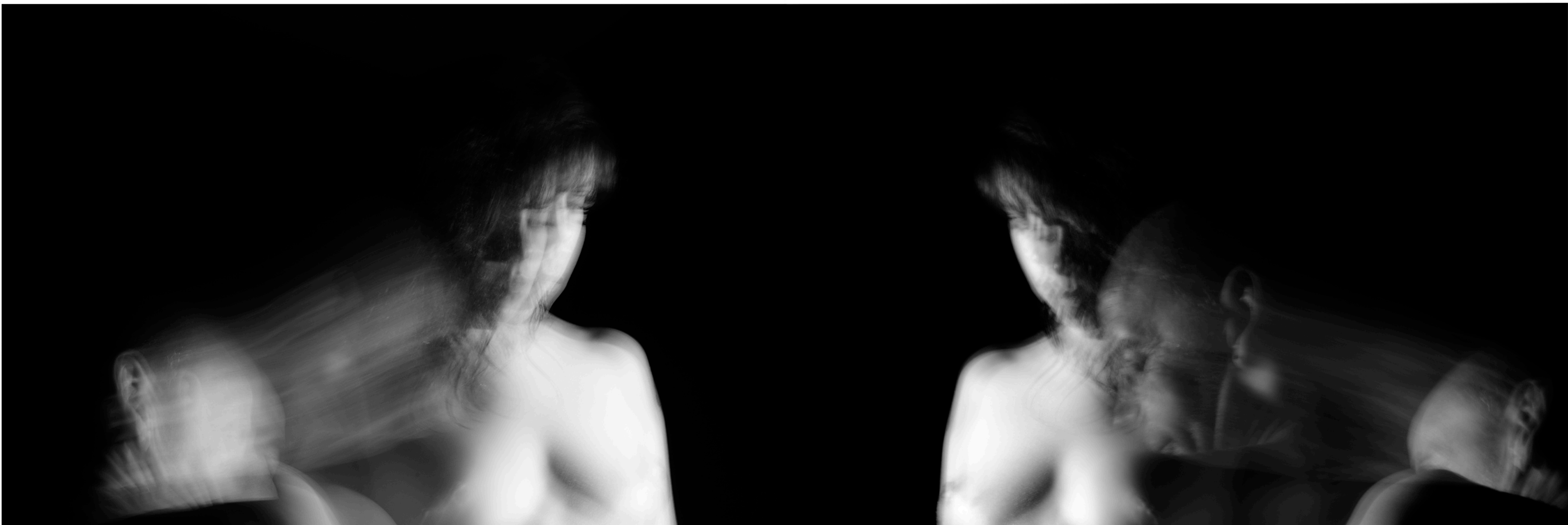
TÍTULO: Huésped I DIMENSIONES: 60 x 40 cm TÉCNICA: Digital Año: 2021